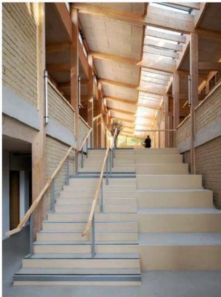
Le centre Gilbert-Raby, à Meulan (78), est spécialisé dans l'addictologie.

la charpente. Elle protège une large rue intérieure donnant accès aux salles où l'on peut pratiquer peinture, cuisine ou céramique. Leurs murs sont de briques à la belle couleur de miel, fabriquées à Sevran avec de la terre crue provenant des déblais de chantier du Grand Paris. La lumière, soignée, descend du toit par des fenêtres en hauteur favorisant aussi la ventilation. L'ensemble est isolé par un « cocon » de liège et de laine de bois, très efficace contre les variations thermiques. Plus sensible à son environnement, l'architecture se réinvente par les matériaux, et ce n'est pas un slogan mais une réalité. — X.J.