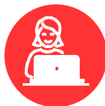
Agents en charge de la création des identités