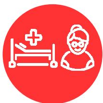
Usagers du système de santé

Le RNIV fixe les exigences et recommandations en termes d'identification des usagers dans les différents secteurs de la santé afin de maîtriser les risques dans ce domaine. Les exigences listées dans le RNIV sont opposables à tous les acteurs* :