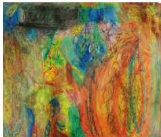
© 2011 - Altes et Réves de Seine, Paris, 2011

Des peintes exposants ont fait du territoire artistique qu'ils font la capitale.