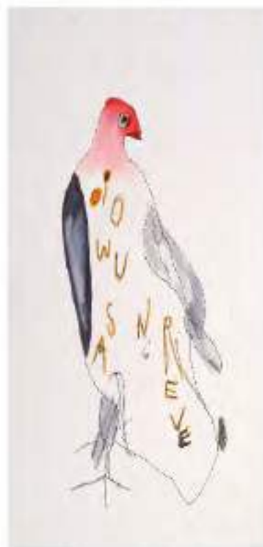
© Association ZigZag Color - 92110 Bagneux, France

Peintures, sculptures et photos de jeunes artistes autistes de l'association ZigZag Color