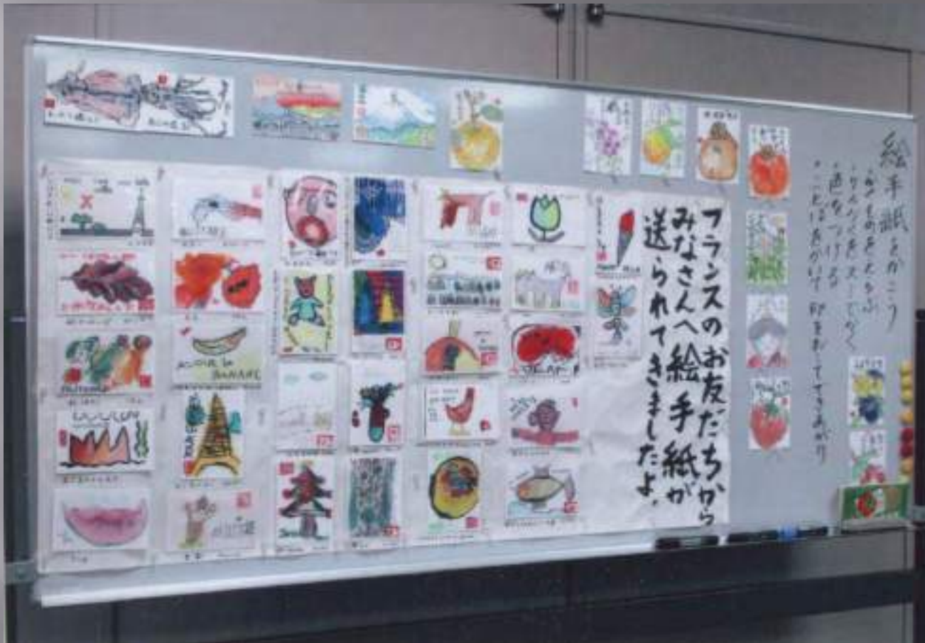
Exposition de nos E-tegami à TOKYO