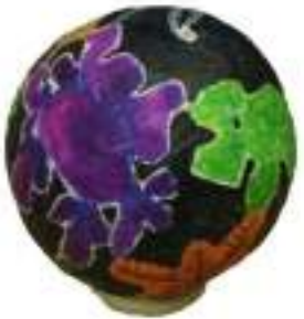
"Radiants" 30 cm