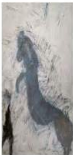
© 2017 - Enfant de la dalle, enfants de Li-Ouz, Sèvres, 2017

SALLE OUVANTE : Exposition Enfant de la dalle, enfants de Li-Ouz, Sèvres, 2017