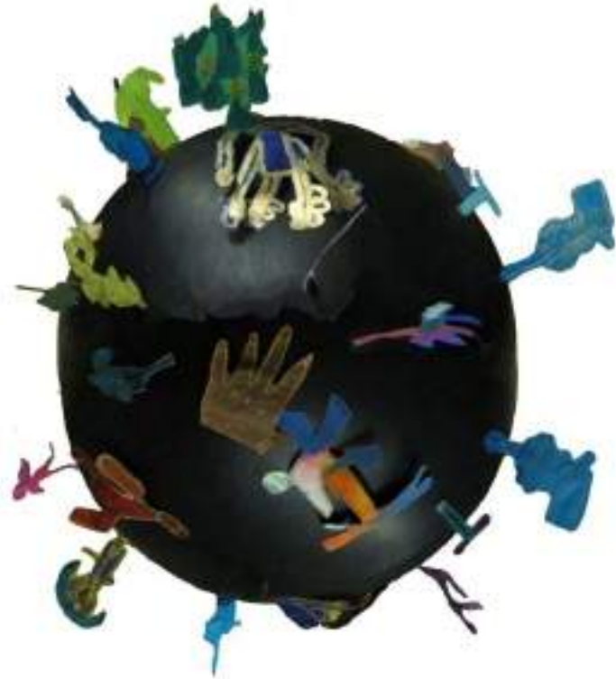
"Captants" 1 m