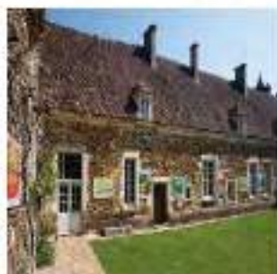
Le Château tout ouvert à son plus bel exposition.