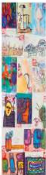
© 2017 - E-legend, une image pour un message, avec l'association Pigments et Arts du Monde

« La maladresse n'est pas un problème. Soyons maladroits ! »