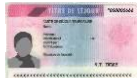
Carte de séjour