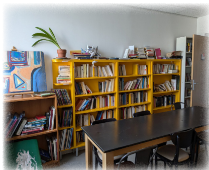
Bibliothèque, 6 ème étage

Ils se déroulent au sein du service ou à l'extérieur.