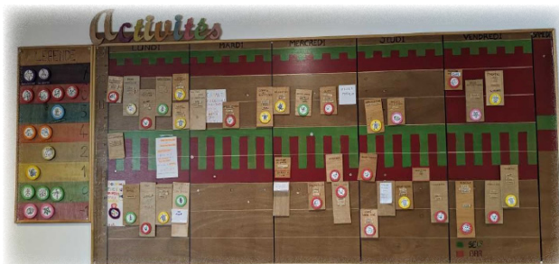
Panneau des activités, club, 6 ème étage