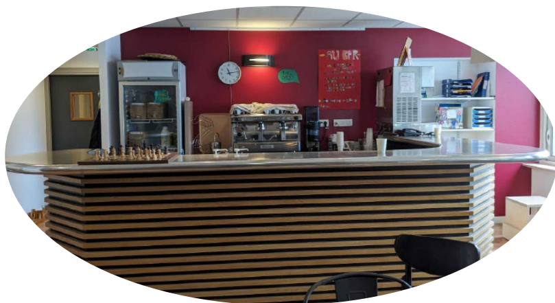
Bar, Club, 6 ème étage