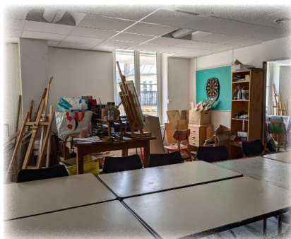
Atelier, 6 ème étage