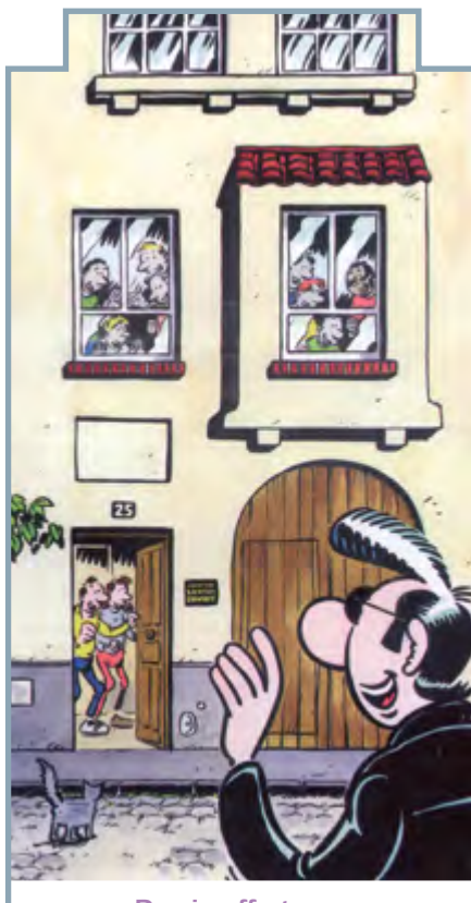
Dessin offert par Frank MARGERIN en 1993

La spécificité de l'hôpital de jour Santos-Dumont est d'accueillir à partir de leur adolescence, des personnes présentant des symptômes d'autisme (dans les classifications actuelles : TSA).